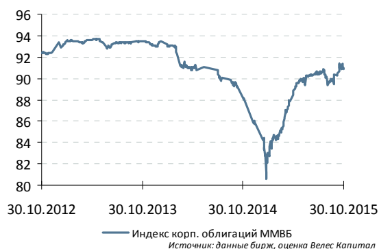
Индекс корп. облигаций ММВБ