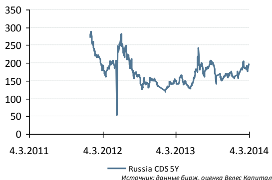
Russia CDS 5Y

Судя по сохраняющемуся росту ставок денежного рынка (в среду значение MosPrime o/n выросло до нового локального максимума с июля текущего года), экспортеры продолжают усиленно продавать валютную выручку, готовясь к основным налоговым платежам и поддерживая тем самым рубль. Так, большую часть дня в среду доллар торговался дешевле 65 рублей, хотя во вторник «закрывался» выше данной отметки. В ходе вечерней сессии в среду американской валюте вновь удалось на какое-то время закрепиться выше 65 рублей, однако к закрытию торгов доллар все же упустил данную отметку. В пользу рубля также необходимо отметить появившиеся на рынке надежды на улучшение отношений России с западными странами в связи с последними событиями, что, прежде всего, может благоприятно