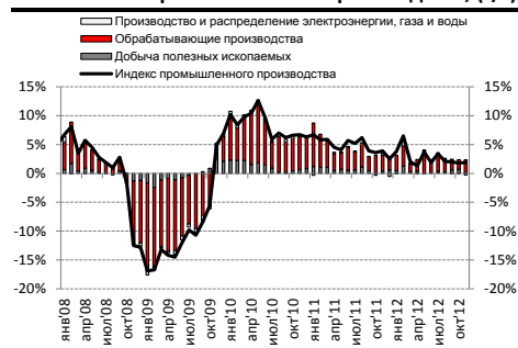
Компоненты промышленного производства, (г/г)

Промышленное производство. В ноябре промышленное производство неожиданно ускорилось на один пункт до 1.9% г/г после 1.8% г/г месяцем ранее. С учетом коррекции на сезонный и календарный факторы промышленный выпуск вырос на значительные 0.6% м/м, практически полностью нивелировав неожиданное падение в октябре (-0.7% м/м). В то же время ноябрьский рост, вероятнее всего, был обусловлен разовыми событиями, поэтому возобновление быстрого роста промышленного производства в краткосрочной перспективе кажется нам весьма маловероятным. С точки зрения монетарной политики стабилизация роста промышленности поддерживает выжидательную позицию ЦБР, но мы опасаемся, что продолжение замедления показателей внутреннего спроса подтолкнет регулятора к смягчению денежно-кредитной политики после того, как в конце 1к'13 инфляционное давление начнет ослабевать.